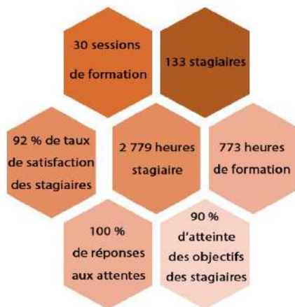
Évaluation des formations - années 2020 et 2021